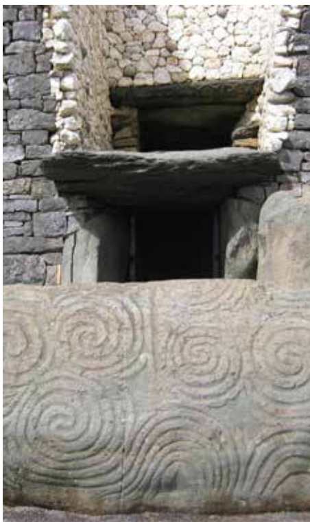
Newgrange, Co. Meath, Irlanda.

Para nuestra asamblea general y las festividades de nuestro aniversario del 30 de mayo al 1º de junio de 2014, tenemos la intención de investigar este tema y dirigir la mirada hacia los impulsos que nos siguen llegando desde los misterios de Hibernia, un hecho comentado por Rudolf Steiner en diciembre del año 1923. A este fin celebraremos un encuentro en la ciudad de Drogheda, en Boyne Valley, situada al norte de Dublin, donde realizaremos un trabajo para entender cómo estos impulsos se han transformado desde entonces: ¿Dónde ac-