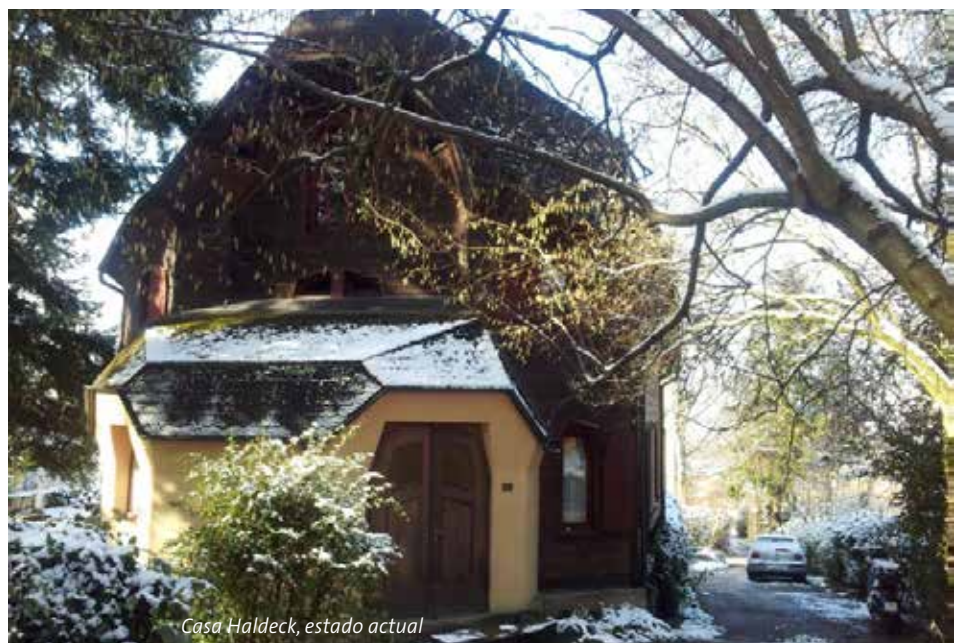
Casa Haldeck, estado actual

Esta moción cuenta con el apoyo de 70 miembros.