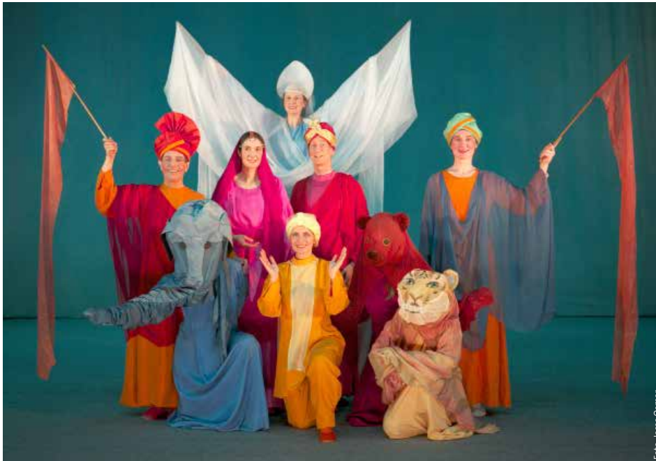
Lenguaje universal: la euritmia en la India. Aportaciones de la cultura europea e india