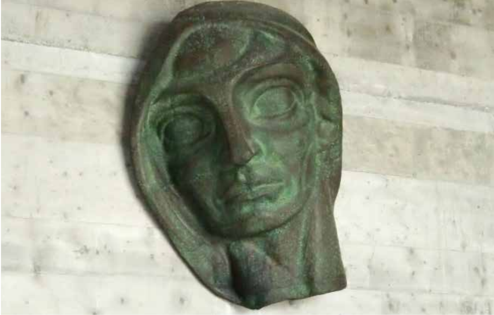
Unirse en amor con el mundo: rostro de Micael, de Walther Kniebe, copia expuesta en el Goetheanum.

Con el tema del año «'El Yo se conoce a sí mismo' - a la luz del Sí micaélico al mundo» se continúa el arco que se tiende desde la sociedad hasta la individualidad. Esta, al igual que la sociedad, se ve colocada ante diferentes retos, como el sentirse realmente contemporánea, pero también más allá, de encontrar una relación con el mundo como fundamento del autoconocimiento.