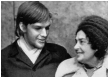
Lina Codina y Sergej O Prokofieff, 1982 en Londres

Sergeij Prokofieff veía a la Sociedad Antroposófica en deuda con Rudolf Steiner pues era sólo «una sociedad de conocimientos» (2). Dornach debía devenir el