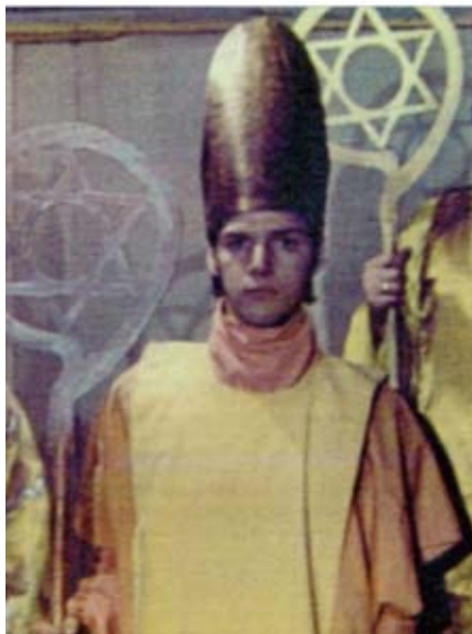
Sergej Prokofieff en el Drama Misterio El Portal de la Iniciación

lugar donde se pudiera vivenciar verdaderamente la Entidad Viviente y supra-sensible Antropo-Sofía, como nuestro núcleo cristológico (2).