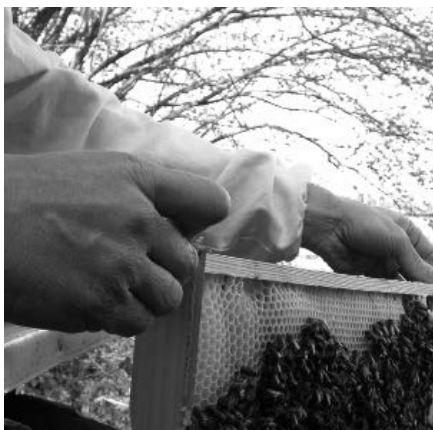
Trabajo con las abejas

Los ácaros Varroa son los parásitos a los que más responsabilidad se les atribuye por la muerte de las abejas. Los apicultores saben muy bien: si las colmenas no se limpian oportunamente de los ácaros Varroa invasivos, repetidamente se producen pérdidas de colonias.