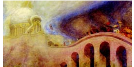
Hermann Linde: El templo del «Cuento» de Goethe