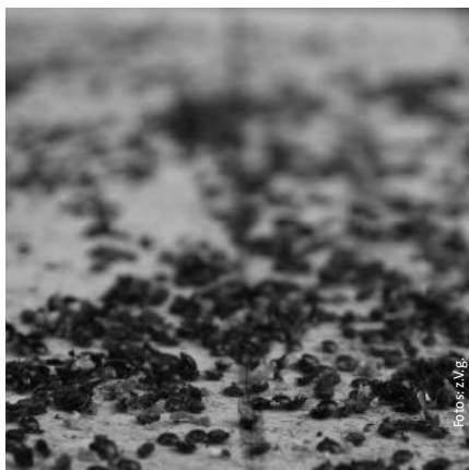
Ácaros Varroa en una colmena, exterminados

El control de parásitos mediante ácidos es un proceso grave pero inevitable dentro de las actividades apícolas. Para el apicultor que se propone cuidar el ser de la colonia, este tratamiento es una de las intervenciones más masivas en el curso del año. Por eso es tan importante buscar nuevos caminos.