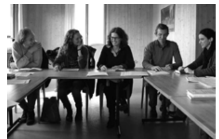
Grupos de trabajo, encuentros, iniciativas