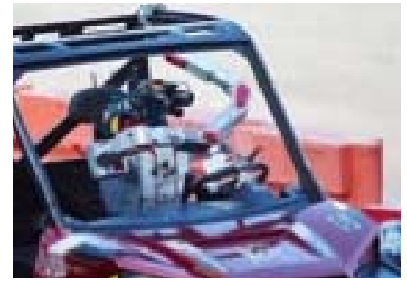
Centro de la atención en el Foro Económico Mundial: el robot DRC-Hubo

Con este enfoque, Rudolf Steiner vuelve a dar valor al trabajo espiritual, olvidado en