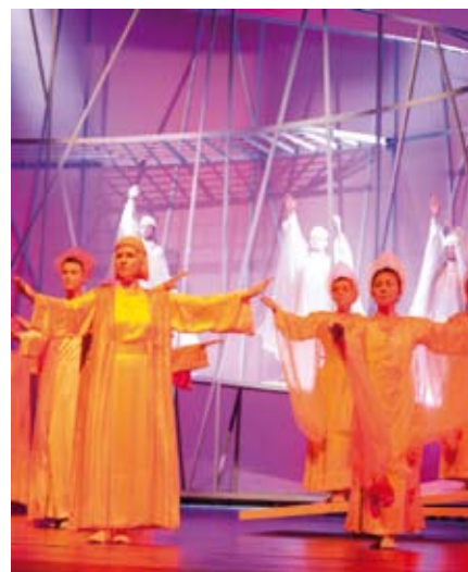
«El hombre yerra mientras tiene aspiraciones»: Prólogo en el cielo, «Fausto»

La humanidad está ante el desafío de despertar - y este es un asunto de todos. Cada vez que emitimos un juicio sobre otra persona, la humanidad va a pique. Tenemos que estar dispuestos a escuchar las voces de los que son diferentes y tienen otras creencias que nosotros. La tolerancia es sólo un primer paso. Ser humano significa ver en