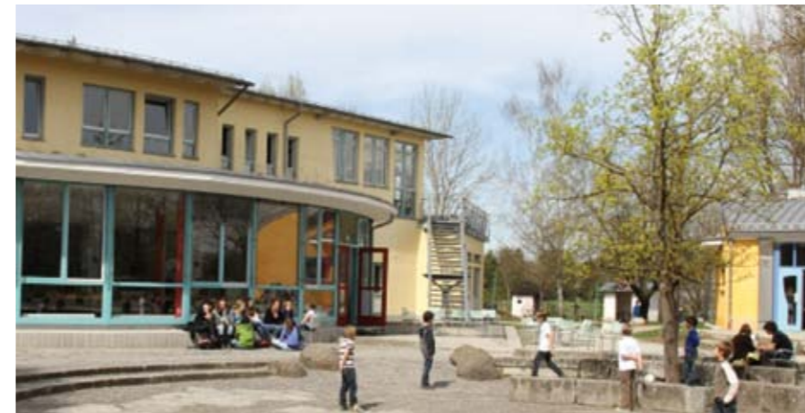
Escuela Waldorf de Gröbenzell (DE)

Durante las últimas décadas, muchas iniciativas, instituciones y empresas han nacido de impulsos antroposóficos. A pesar del buen rendimiento general, hay problemas sociales tales como la sobrecarga de trabajo, salarios insuficientes y conflictos en curso. La Escuela Rudolf-Steiner de Gröbenzell (DE) muestra cómo la «trimembración del organismo social» puede ser una respuesta.