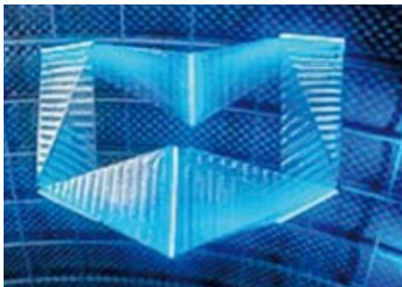
Objeto volador «SmartInversion»

Haciendo clic en «Film», se activa un video que muestra el objeto volador en acción.