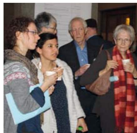
Descanso: Espacio de conversación e información

Una y otra vez se escuchó el motivo de reflexionar sobre el elemento que nos une en la antroposofía: «Nos conocemos todos. Tenemos un proyecto co-