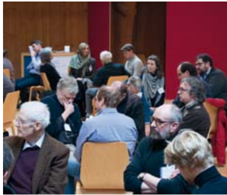
Conferencias y grupos de conversación: un congreso anual rico en iniciativas

El cuarto encuentro de la Conferencia de Economía del Goetheanum se celebró del 22 al 24 de enero de 2016 en L'Aubier en Suiza. Se trató sobre el futuro de los bancos y el sistema crediticio en relación con la naturaleza y el ser humano.