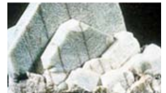
Fragmento de feldespato

Para más información sobre los preparados biodinámicos, los nuevos preparados de feldespato y la solicitud de preparados, vale la pena consultar la página web de la Asociación de Agricultura Biodinámica de España, http://www.biodinamica.es/preparados.html .