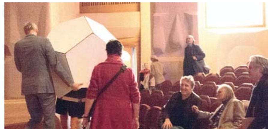
Regalo de las Países Bajos dodecaedro pentagonal diseñado por Rik ten Cate