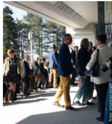
En la nueva entrada oeste

Unos golpes de gong instaron a los presentes a dirigirse, a través de la exposición de fotografía sobre la nueva escenificación de «Fausto 1 y 2» de Goethe, hacia la Grosse Saal (Sala Principal). También aquí se sucedieron las sorpresas. El año anterior, jóvenes miembros de la Sociedad se habían dirigido a Justus Wittich con el deseo de darle calidez a la recepción en el Goetheanum y de hacer la Sociedad mundial más animada a través de aportaciones y manifestaciones originales y nuevas atmósfe-