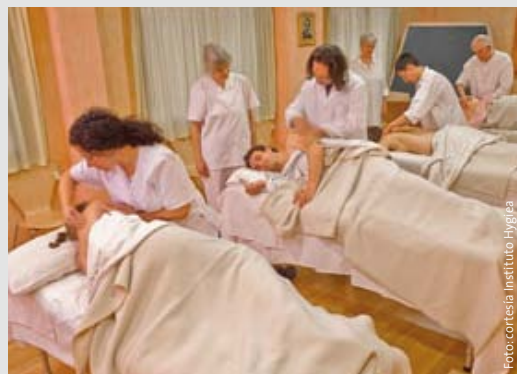
Prácticas de alumnos durante un curso de formación

En un encuentro de profesionales de masaje Pressel diplomados en los cursos anteriores del Instituto Hygiea, celebrado del 21 al 24 de abril 2016 en El Escorial, aparte de tr abajar los recursos del Masaje Dr. Pressel para tratar los distintos síntomas de desvitalización, se abrió un debate sobre las posibilidades y necesidades de constituir a largo plazo una asociación de masajistas Dr. Pressel, crear una plataforma virtual para profesionales, y organizar una formación de formadores.