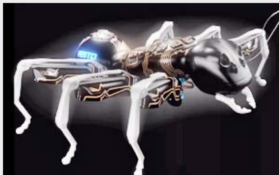
Hormiga robot diseñada para la construcción de estructuras de células artificiales o circuitos eléctricos