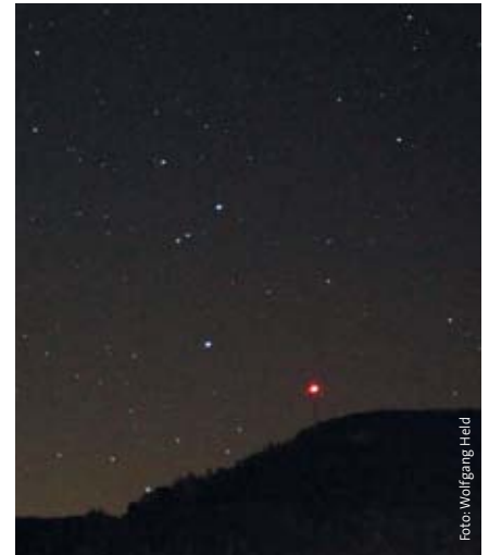
Origen cósmico del cuerpo humano: Escorpio sobre Dornach, 22 de agosto, poco antes de las 23 horas

Para hacer esto posible, el ser solar, el Cristo, vino a la tierra. Él aspiró y transformó el zodiaco con sus 12 signos. El Cristo hace «que lo exterior y lo interior sean mutuamente fructíferos; comienza el momento en el que lo interior deviene exterior, en el que irrumpe hacia el espacio lo que antes sólo tenía vida interna en el tiempo y cuyos elementos ahora están colocados uno al lado del otro. [...] Bueno, todo lo que está estructurado en el tiempo, está estructurado de acuerdo con la medida y la naturaleza del número siete.