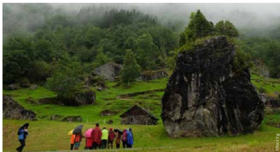
Conciencia humana y naturaleza poderosa: peñasco del trol en el fiordo de Hardanger