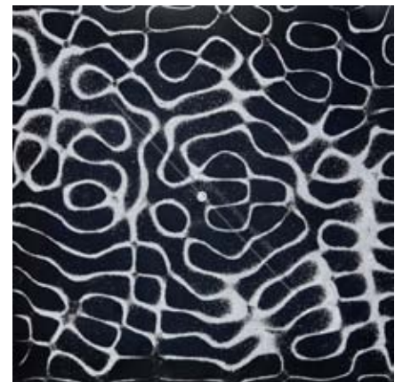
Figuras de Chladni