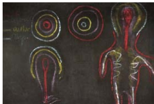
Curso de pedagogía especial, pizarra 7, quinta conferencia

de la conciencia del mundo a la autoconciencia), ningún proceso de desarrollo puede en realidad ser entendido ni tener un transcurso armonioso. Todo desarrollo tiene lugar en la zona de transición, en el cruce, y en el movimiento pendular entre dos polos opuestos. [...]