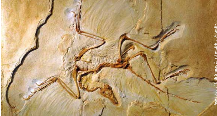
La identidad única de un organismo: el Archaeopteryx

Del 17 al 19 de mayo se celebró un coloquio en el Centro Ruskin Mill Field para estudiar la evolución biológica. El grupo estaba formado por siete representantes de la filosofía, la práctica meditativa, la medicina, la investigación hidrodinámica, la radiestesia, la pedagogía y la biología evolutiva; todos ellos con experiencia en el método Goetheano.